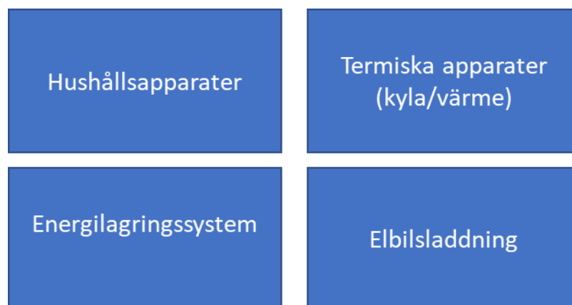
Figur 1: Uppdelade områden inom fleksibilitet.

Utifrån den potentiella fleksibilitet som olika apparater kan erbjuda kan en distinktion göras enligt följande områden avseende potentiella resurser för efterfrågefleksibilitet: