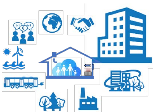
Figur: Forskningsområdet "Byggnader i energisystemet" och dess omgivning, i enlighet med aktuell strategi för området. Programmet har kopplingar till flera relaterade områden, framförallt "Hållbart samhälle", "Hållbar industri", "Hållbara biobränslen", "Hållbar transport", "Hållbar el", "Allmänna energisystemstudier", "Internationella samarbeten" samt "Affärsutveckling".

Området tangerar flera andra områden, exempelvis småskalig elproduktion ("prosumenter"), lagring och balansering av energisystemet, fjärrvärme, industriell spillvärme, industrilokaler, affärsmodeller, styrmedel, företagens konkurrenskraft och internationella samarbeten.