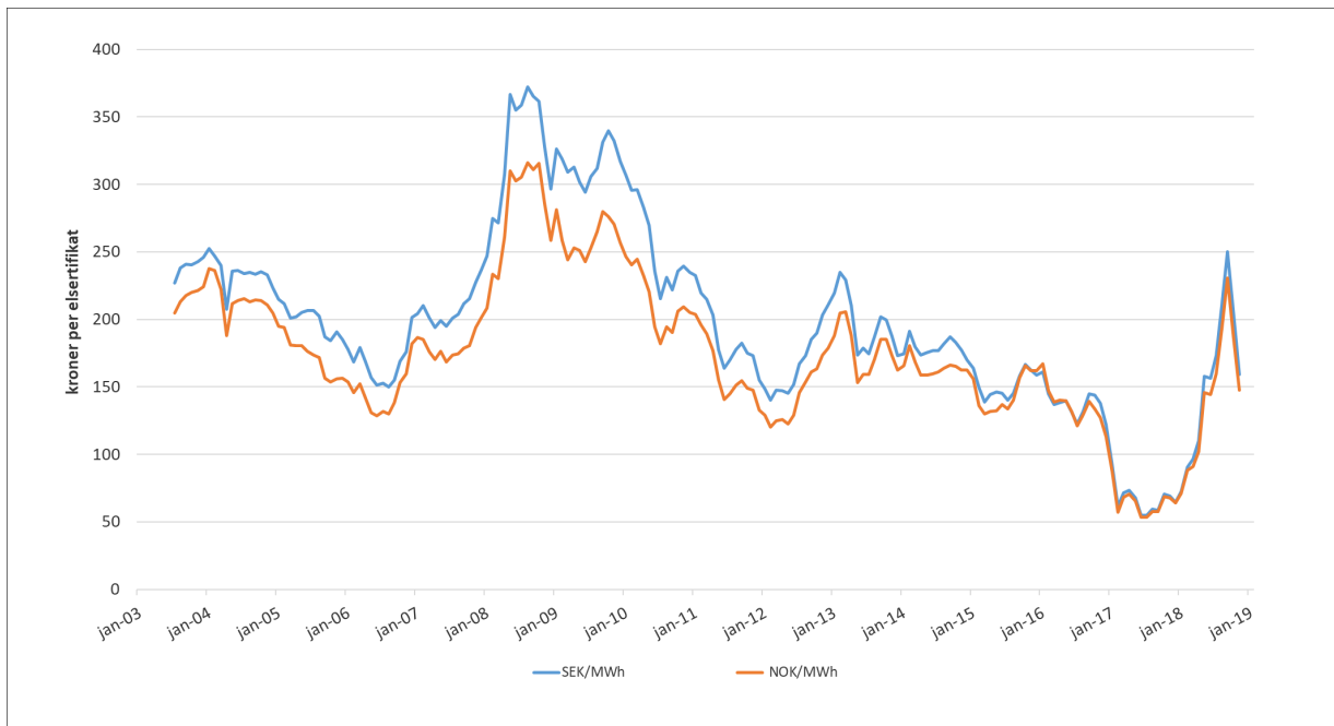
Figur 4. Genomsnittligt (månad) spotkontrakt för elcertifikat handlat hos SKM (uppdaterat t.o.m oktober 2018)