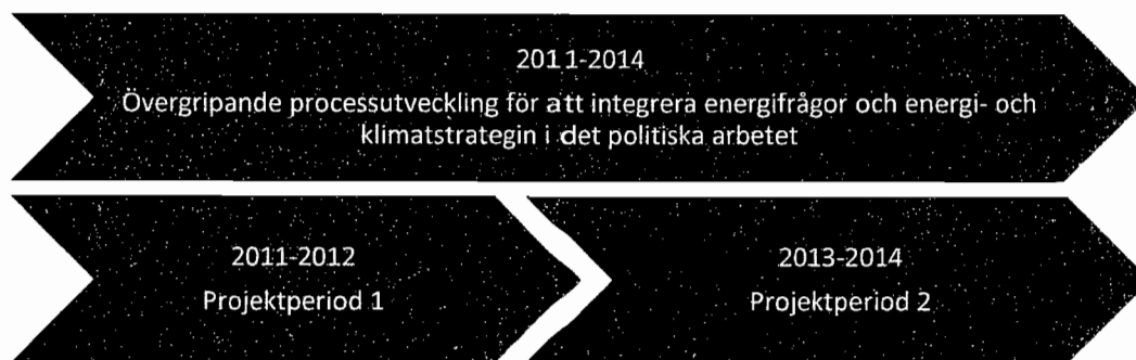
Bild 1: Processförslag för Uthållig kommun 2011-2014

Inom det övergripande arbetet med att integrera energi- och klimatfrågorna i det kommunala ledningsarbetet finns det inga projektmedel att söka utan här utformar Energimyndigheten ett grundläggande stöd. Den politiska förankringen och vikten av att den politiska ledningen vågar ta tag i svåra energi- och klimatrelaterade frågor kommer att vara allt viktigare i nästa etapp. Detta särskilt mot bakgrund av att ett välförankrat arbete bland kommunens ledande politiker och tjänstemän har visat sig vara en framgångsfaktor. Ett väl förankrat arbete där den politiska majoriteten och oppositionen har blocköverskridande överenskommelser i ett långsiktigt energi- och klimatarbete har stor betydelse för ett framgångsrikt arbete i kommunerna. Etapp 3 av Uthållig kommun föreslås innehålla färre kommuner för att möjliggöra mer direktkontakt mellan myndigheten och de deltagande kommunerna.