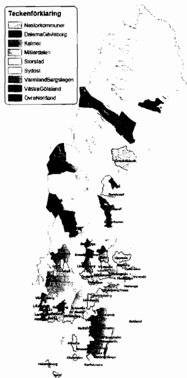
Figur 1: Regional indelning av deltagande kommuner i 8 stycken sk kluster.

På Energimyndighetens uppdrag har samtliga klustersamordnare initierat upptaktsmöten med kommunernas kontaktpersoner: